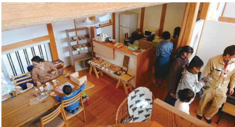
↑土塗り壁モデルハウス内の様子↑ 里のパン工房nicoさんの洋菓子・パン・ドリンクの販売と雑貨・家具のガレッジセールを行いました。