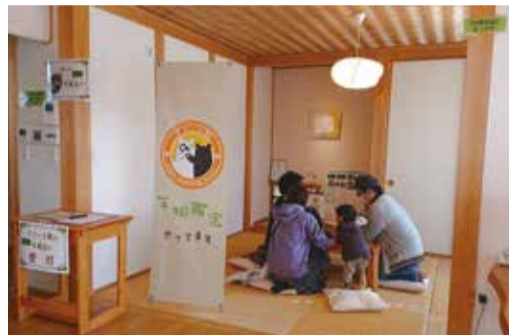
↑ZETHモデルハウス内の様子↑ 住宅相談や手相占いを行いました。