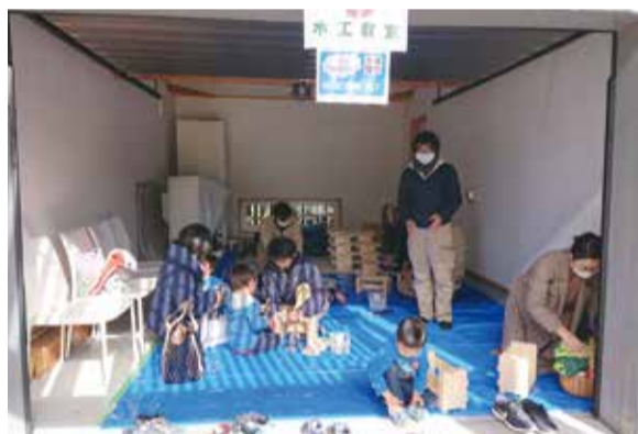
↑木工教室の様子 可動式本棚を作りました。