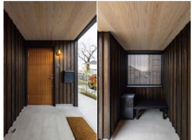
幹線道路からの視線を格子で遮り、明るさと広がりのある玄関ポーチ。