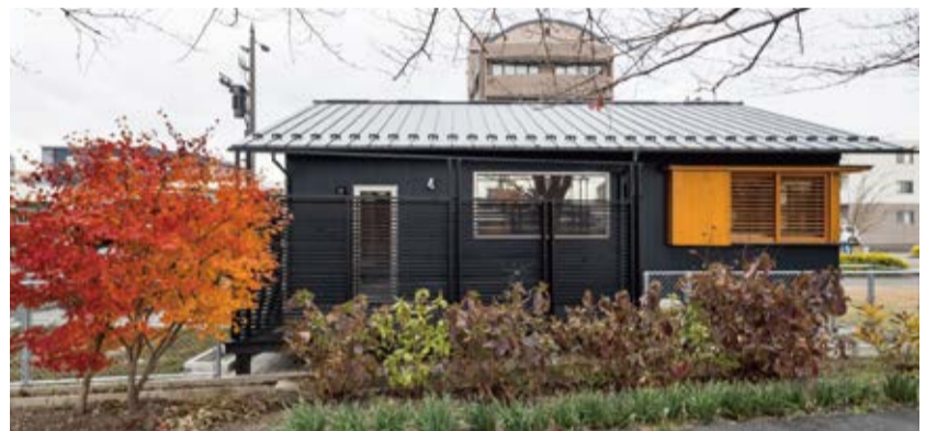
室内から河川敷の草木を眺められる窓を配置計画しました。

この家に住み始めて2度の冬を過ごしましたが、冬でもやっぱり暖かいと感動しています。 自宅を計画中も自分の生活パターンがイメージできていたので、自分でも驚くほど後悔した点がありません。設計の加藤さんともコミュニケーションが上手く取れていたんだと思います。 本当に良い家を一緒に造っていただき、ありがとうございました。