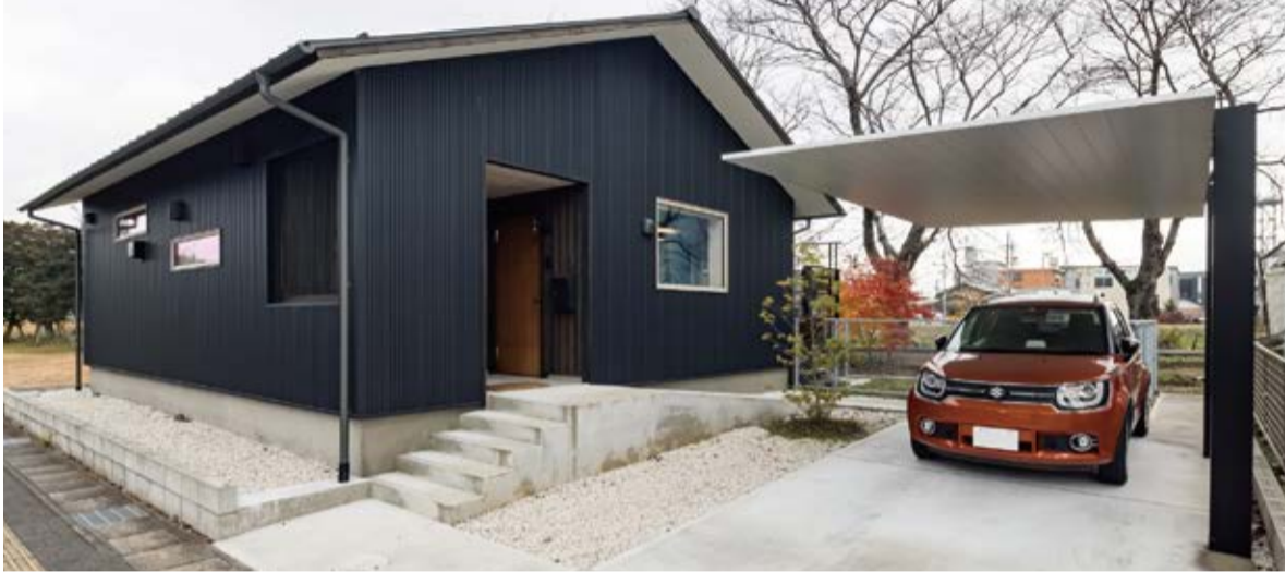
シンプルな外観。将来を見据えてスロープも設置。