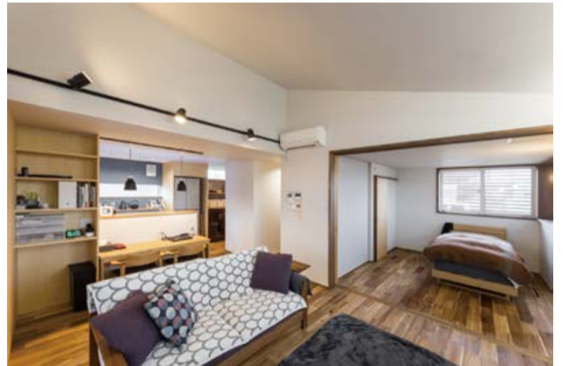
傾斜天井で視線を縦に、窓をコーナーに配置することで、距離感と広がりを持たせました。