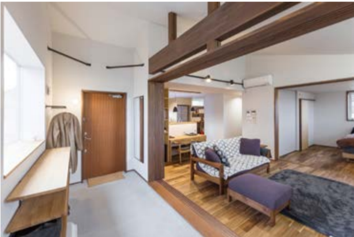
玄関からリビングへの段差を抑えてバリアフリーに。引戸を収納すると、開放感のある空間に。