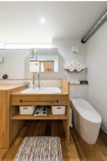
介護を想定し、洗面とトイレを一室に。