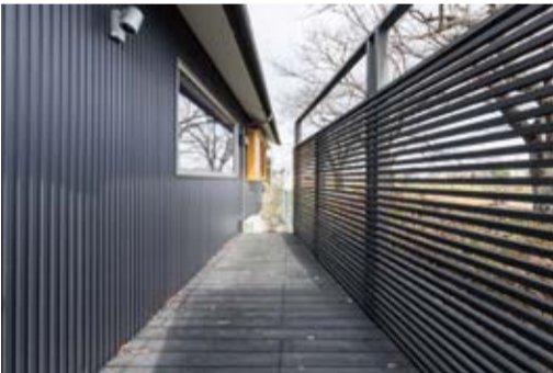
河川敷の桜をプライベートに借景として楽しめるウッドデッキ。