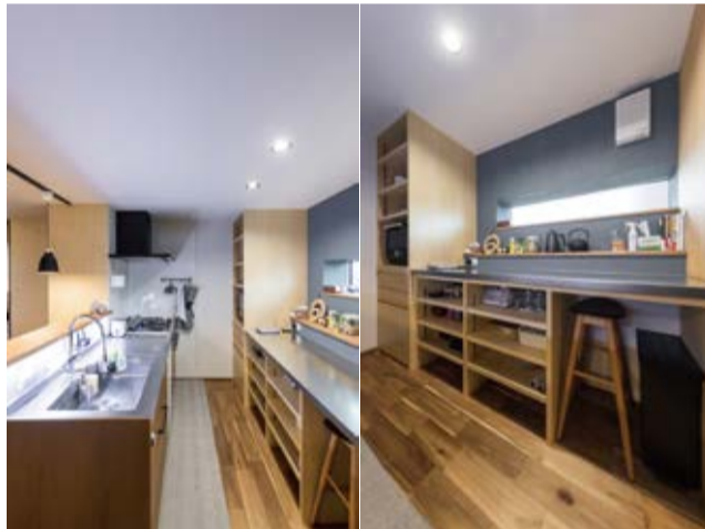
木とインダストリアルをMIXしたキッチン。