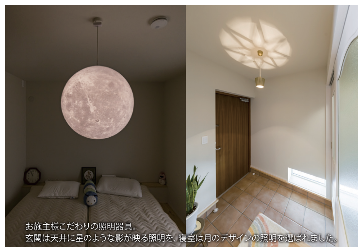
お施主様こだわりの照明器具。玄関は天井に星のような影が映る照明を、寝室は月のデザインの照明を選ばれました。