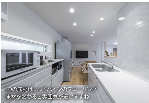
LDの床材はレッドパインのフローリング床材が変わると雰囲気は違いますね