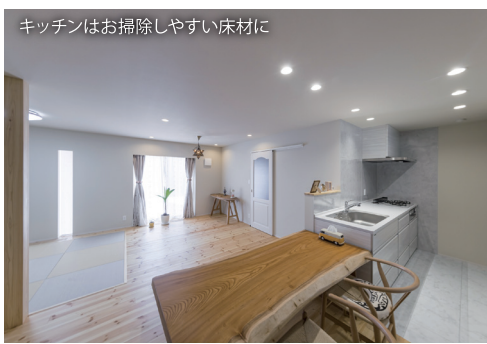
キッチンはお掃除しやすい床材に