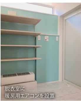
脱衣室に暖房用エアコンを設置

楽園住宅さんで建てて心から良かったと思いました。今回建てていただいたこの家は我が家の宝物です!!