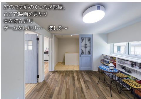
2Fのご夫婦のくつろぎ部屋。ここで映画を見たり本を読んだりゲームをしたり... 楽しそ〜