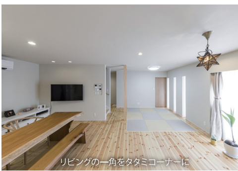
リビングの一角をタタミコーナーに