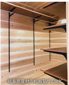
岐阜県産材の杉板貼りのWIC