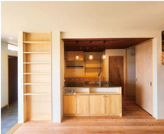
キッチンは無垢のシステムキッチン ニュージープラインでお施主様の好みに合わせました