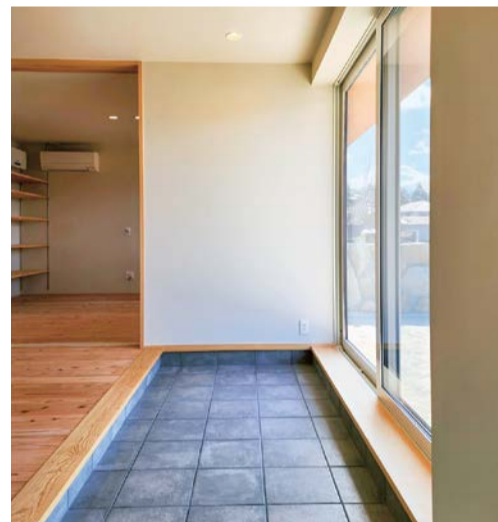
お施主様こだわりの玄関から続く土間土間に面した窓からの眺めが素晴らしいです