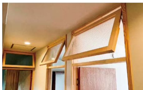
廊下の暗さの軽減と室内の空気循環用に 入ロア上部に押出窓を設けました