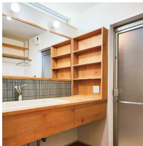
シックなタイルで壁をデザイン 落ち着いた雰囲気洗面所