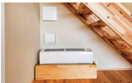
暖房用床下エアコン