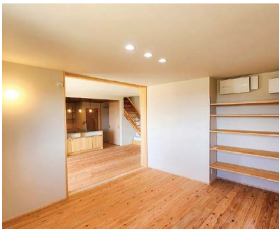
リビングとダイニングの間仕切りは空間の広がり を持たせるために大開口の引込戸としました