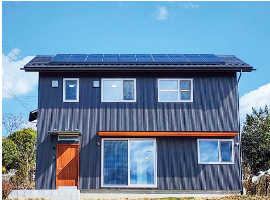
玄関ドアと庇のチーク色が外壁のシルバーブラックに映えます