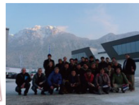
↑工場見学後の集合写真