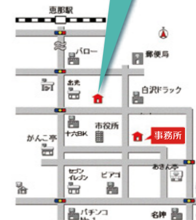
楽園住宅事務所・モデルハウス案内図

【開館時間】10:00~17:00 ※臨時休館の場合もあります 残暑厳しいこの時期でもサラッとさわやかな空間を ぜひご体感ください♪