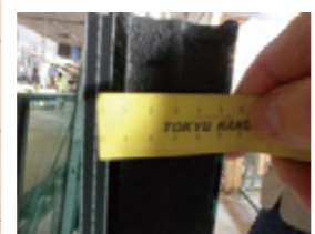
5mm 18mm 3mm 13mm 5mm で 49mm のガラス厚