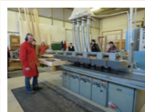
↑6軸のモルダーで窓枠の加工