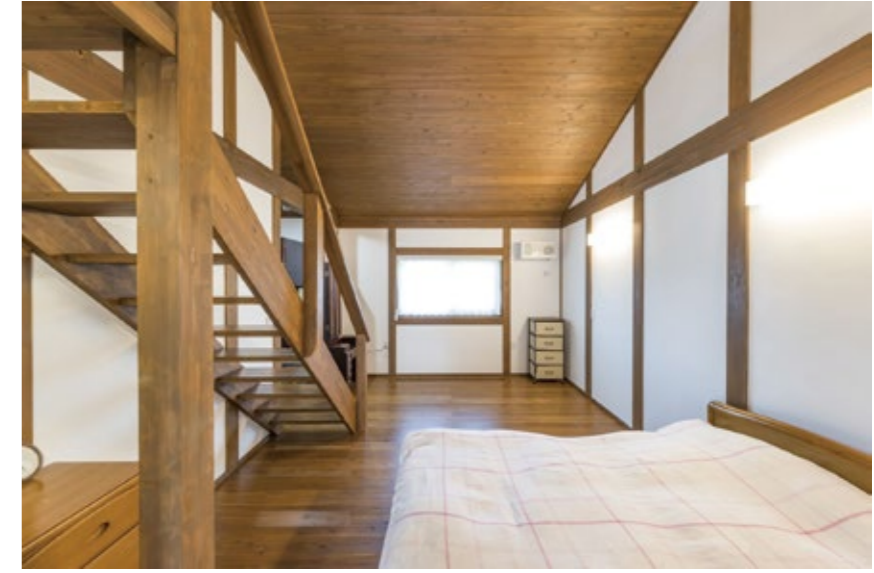
寝室です。左側にある階段からロフトへ上がれます。