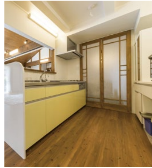
キッチン奥に見える戸の向こうは玄関ホールです。たくさんお買い物してきても、玄関からの動線も短くて便利です。