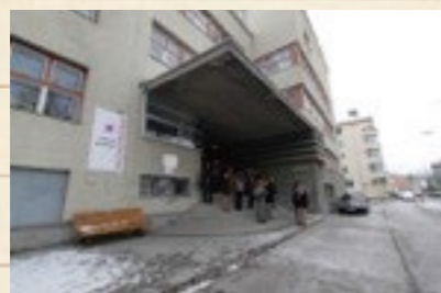
↑中学校 (Mittelschule) の入り口

パッシブハウス基準の省エネ改修工事をおこなっている築80年の中学校を視察した。欧州の中でも注目された学校の省エネ改修工事で、外観を保存する為に内側へ断熱している。その為、外観は変わっていない。改修前の建物は断熱性能も悪く、200kWh/m 2 年(19℃)の暖房エネルギーが消費されていた。この暖房エネルギーを15kWh/m 2 のパッシブハウス基準で暖房が出来るまでに改修した。構造躯体が多孔質のレンガを用いた組積造の為、結露水が毛細管現象で凍結しないように、透湿抵抗比に配慮した施工方法を取っている。また、暖房のラジエーターは鉄製の既存の物を利用し、中に不凍液が通るパイプを入れて利用している。