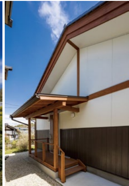
玄関ポーチはウッドデッキ仕様です。