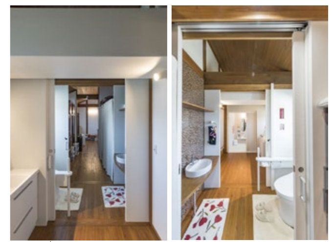
写真手前より、洗面脱衣室、トイレ、クローゼット、寝室と繋がっていて、回遊できる間取りとなっています。