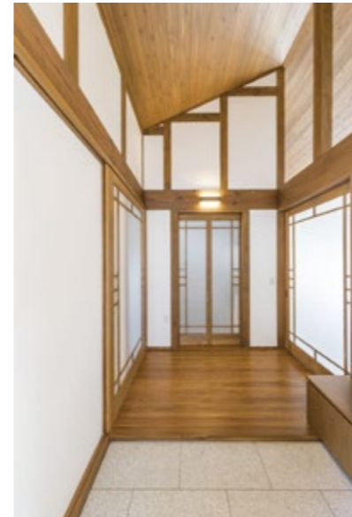
玄関と玄関ホールです。光を通す建具と、勾配天井でとても明るく、広く感じます。