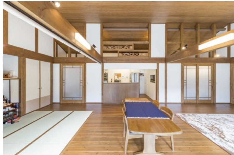
弊社社長宅の離れをご覧になり、ほぼ同じ間取りと内装で造らせていただきました。