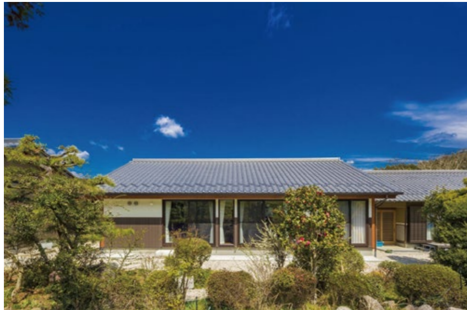
いぶし瓦がカッコイイ平屋建てです。