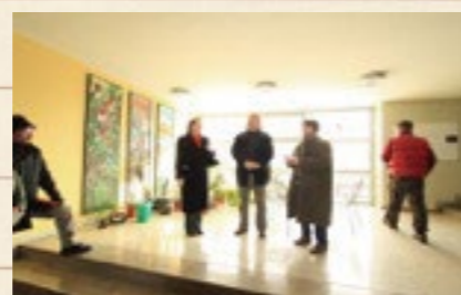
↑ホールで改修工事の説明を受ける

ミッテルシューレ (ギムナジウム、実業中学校) の改修工事は、建築当時の床や壁材の色を再現している。改修は組積造の躯体の室内側へ木材で下地を組んでセルローズファイバーを充填し、室内側は土壁ボードを貼り塗り壁で仕上げている。施工には透湿抵抗を考慮し、水蒸気が壁体内に籠らないように注意した。透湿抵抗は2.6m 2 ・s・pa/ng程度で室内側へ開放している。文化財的な価値が有る為、外観には建設時の雰囲気を可能な限り残す工夫をしている。今後、18ヶ月間を掛けて温熱環境や空気質・照度等の環境調査を実施する計画である。温水ラジエーターの不凍液温度は50℃で、循環後40℃になって戻っている。