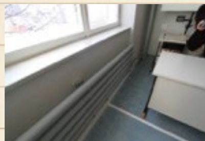
↑旧温水ラジエーターの中に温水パイプを設置

ミッテルシューレ (ギムナジウム、実業中学校) の改修工事は、建築当時の床や壁材の色を再現している。改修は組積造の躯体の室内側へ木材で下地を組んでセルローズファイバーを充填し、室内側は土壁ボードを貼り塗り壁で仕上げている。施工には透湿抵抗を考慮し、水蒸気が壁体内に籠らないように注意した。透湿抵抗は2.6m 2 ・s・pa/ng程度で室内側へ開放している。文化財的な価値が有る為、外観には建設時の雰囲気を可能な限り残す工夫をしている。今後、18ヶ月間を掛けて温熱環境や空気質・照度等の環境調査を実施する計画である。温水ラジエーターの不凍液温度は50℃で、循環後40℃になって戻っている。