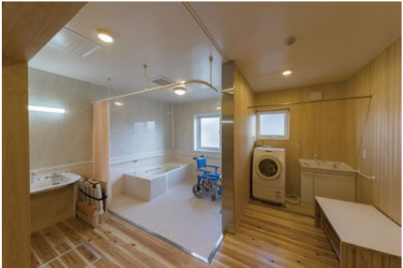
↑こちらは、洗面脱衣室と浴室です。写真には写っていませんが、手前にトイレもあります。毎日使用する場所なので動きやすいように建具で仕切られておらず、一体空間となっています。