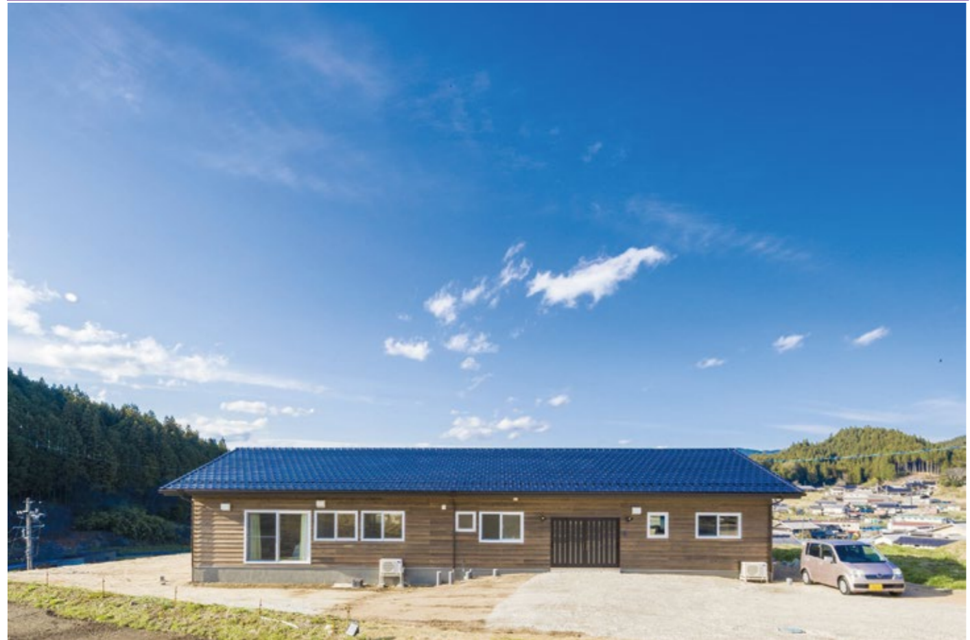
↑こちらは身体に障害のある方が利用される施設です。内部は玄関から右側が大壁仕上げ、左側が柱が見える真壁仕上げとなっています。

C値(相当隙間面積)=0.4c㎡/㎡ Q値(熱損失係数)=1.73W/㎡K UA値(外皮平均熱貫流率)=0.34W/㎡K