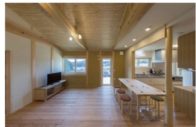
↑住宅でいうLDKです。食事をしたり、くつろいだりするスペースです。施設内はどこへ行っても温度差が少ないため身体に負担がなく、利用する方にも安心してお使いいただけます。