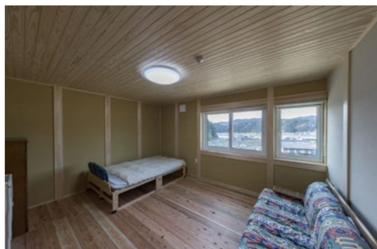
↑もうひとつの個室です。こちらは北側になりますが、大きな窓から一日中安定した明るさが得られます。