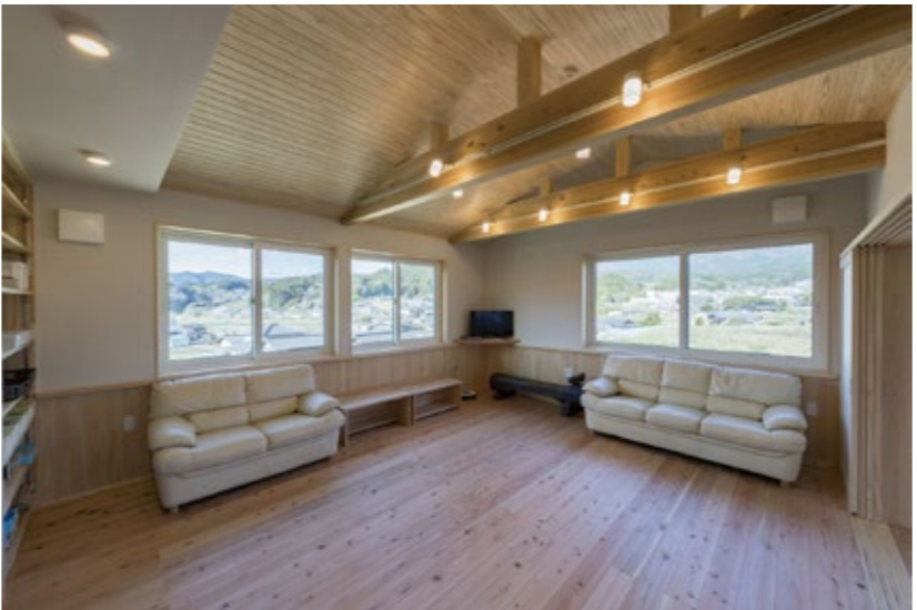
↑多目的ホールです。大きな窓と板張りの勾配天井で開放感が増します。この施設から見える景色は、どの窓から見ても良好です。