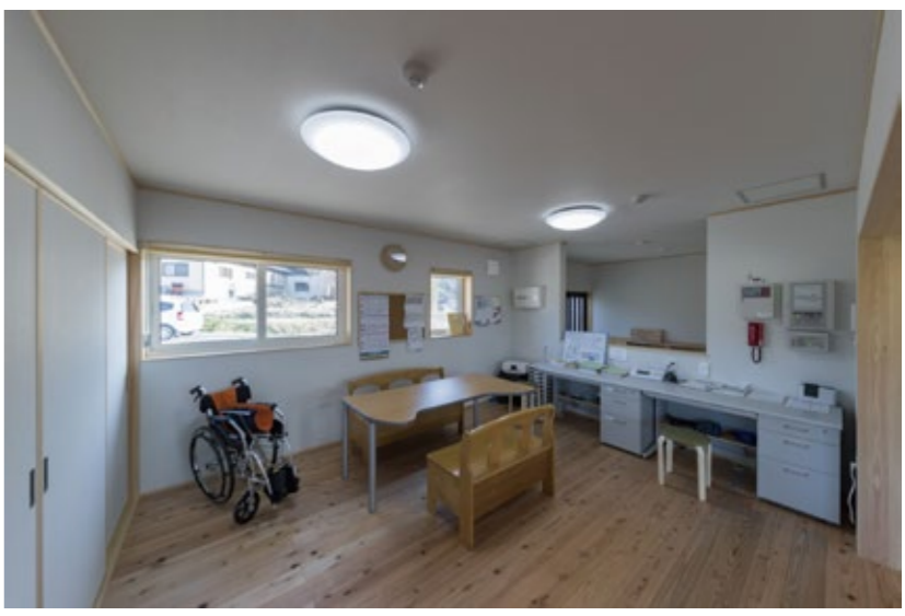
↑事務室です。来訪者にすぐ対応できるように、玄関のすぐ隣にあります。