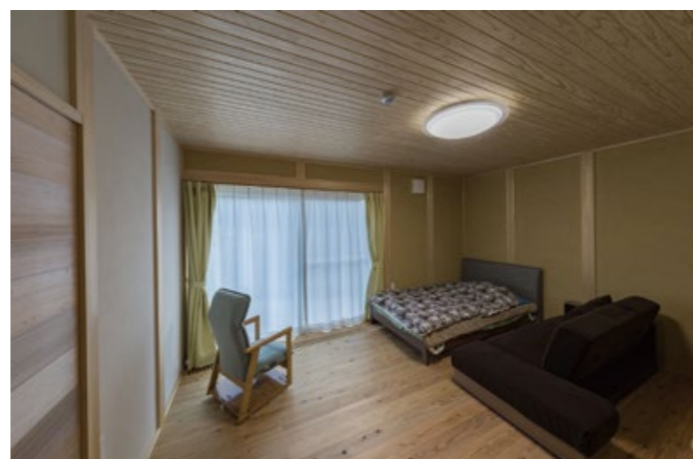
↑この施設には個室が2室あり、そのうちの1室です。介助もしやすいよう、ゆったりした広さです。