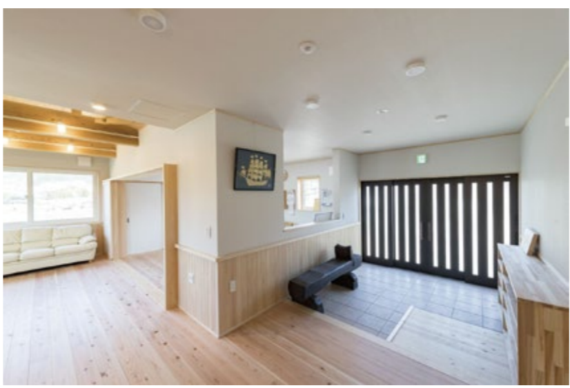
↑玄関です。スロープで段差を解消し、玄関は4枚の引き違い戸で開口巾も広く、車椅子でも出入りしやすくなっています。