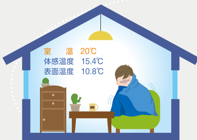
断熱されていない家