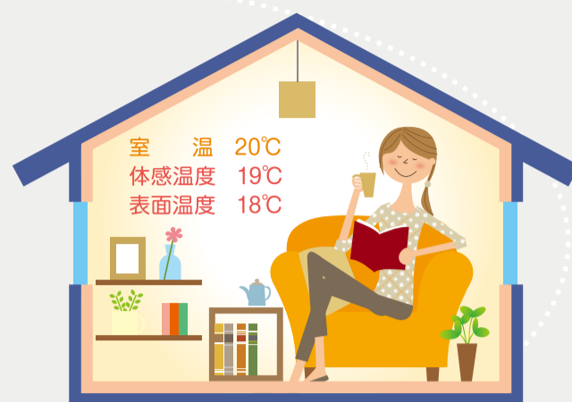
断熱されている家

表面温度が下がりすぎたり上がりすぎたりしないために 床、壁、天井をしっかり断熱しましょう。