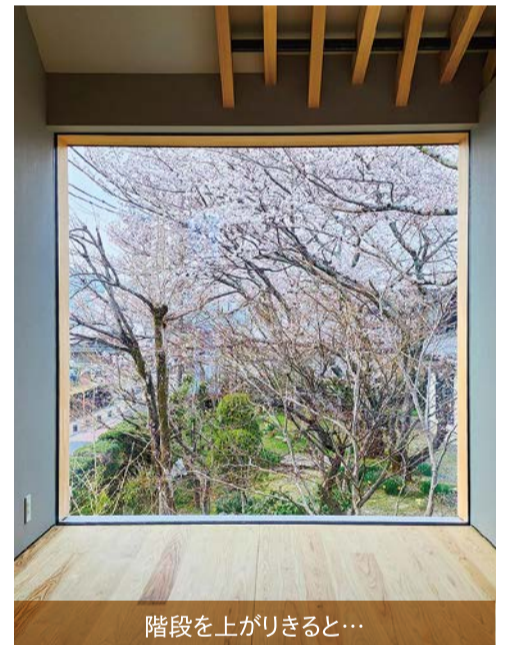
階段を上りきると…