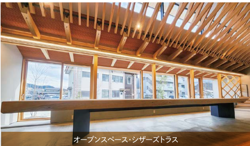
オープンスペース・シザーズトラス