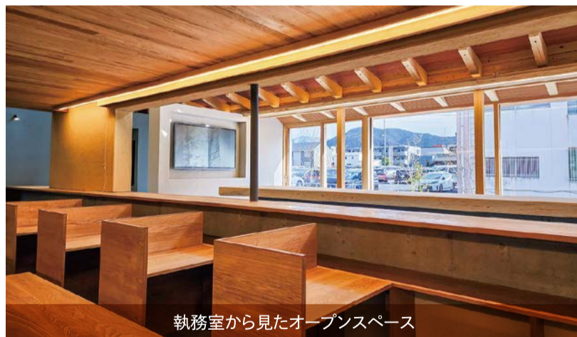
執務室から見たオープンスペース

オープンスペース西側、階段上がり口にはシンボルツリーとなるシマトネリコが植えられています。この階段を上りきりますと、正面には壁一面の窓が。遠くには笠置山、四季折々の花を眺めることができます。