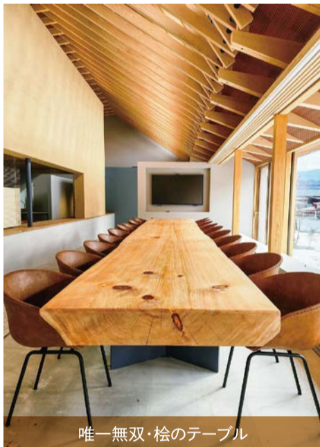
唯一無双・檜のテーブル

オープンスペースと執務室を分ける壁は、皆様にご参加いただき塗り上げた土壁がそびえっております。