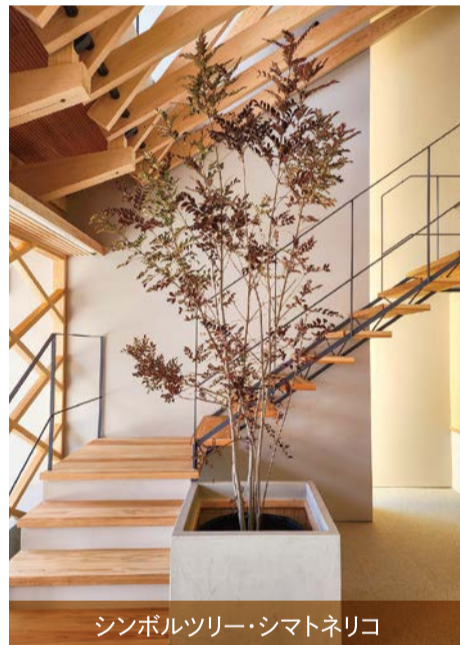
シンボルツリー・シマトネリコ